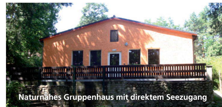
Naturnahes Gruppenhaus mit direktem Seezugang